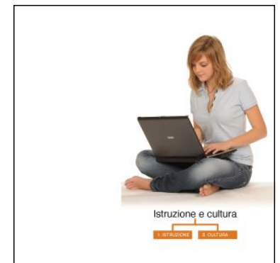
Gli ambiti 3 Istruzione e cultura