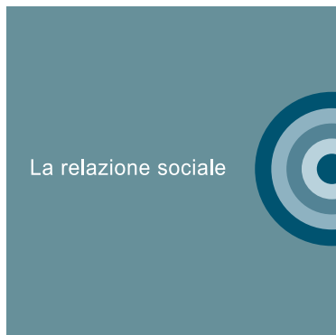
II sezione La relazione sociale