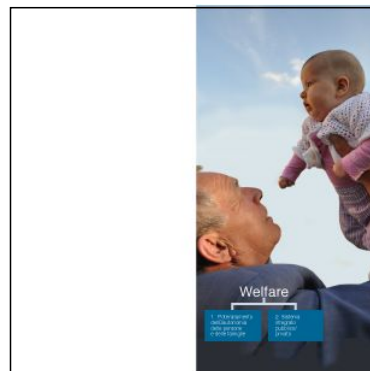
Gli ambiti 1 Welfare