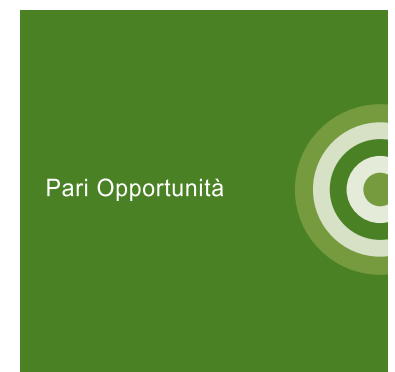
Appendice Pari Opportunità