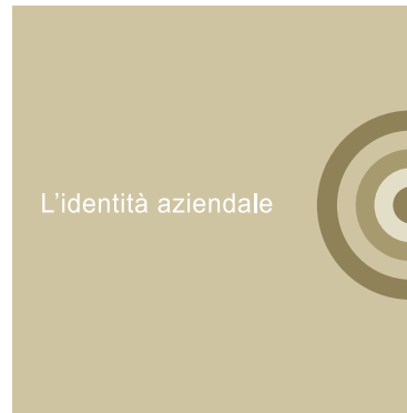
I sezione L'identità aziendale