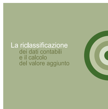
III sezione - Dati contabili e valore aggiunto