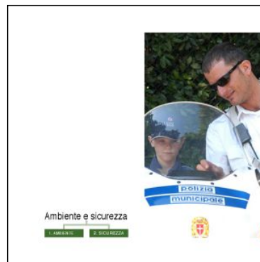
Gli ambiti 2 Ambiente e sicurezza