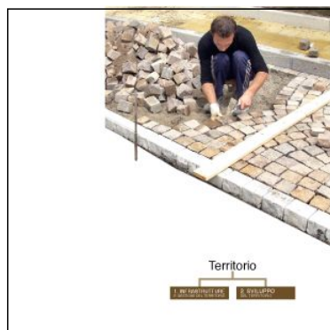
Gli ambiti 4 Territorio